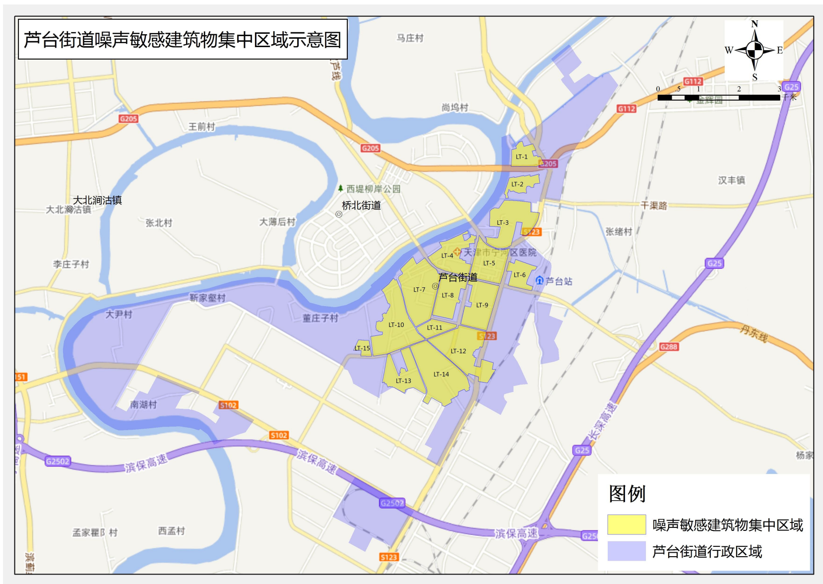
图 2 宁河区芦台街道噪声敏感建筑物集中区域分布图